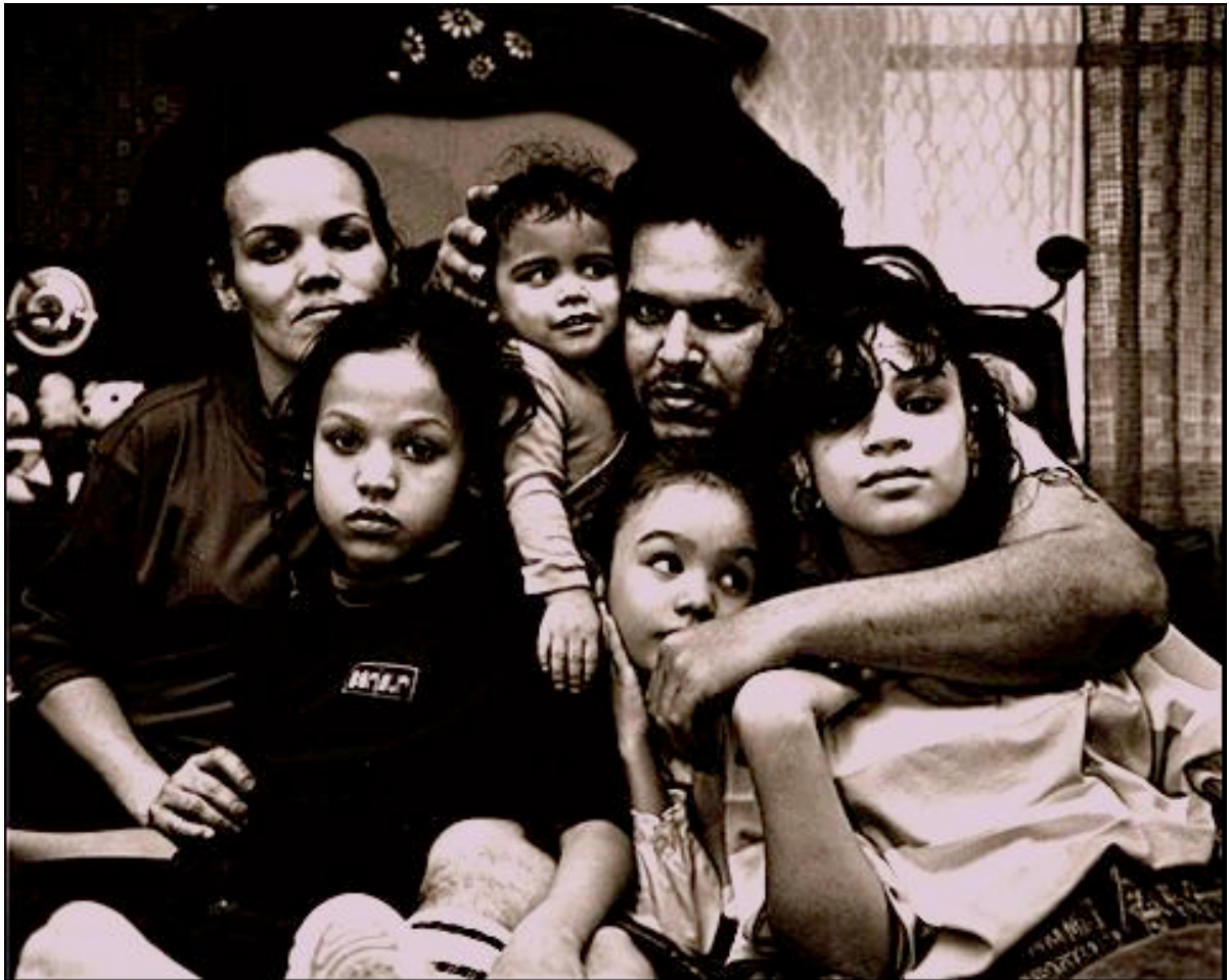
Titolo della foto: Family

Un racconto talmente intimo da avvicinarci al problema della HIV e della tossicodipendenza in maniera diretta e priva di censure.